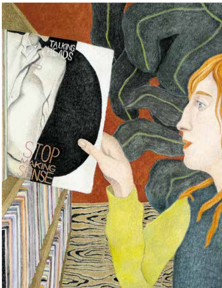
Maeve van Klaveren, Feel It , 2024, Aquarellfarben, Pastellfarben, Pastellstifte und Zeichenkohle auf Papier, 65 x 50 cm

„Die Fragmentierung der Welt ist weit über den Kampf der Großmächte hinaus gelangt“, diagnostiziert der französische Politikwissenschaftler Jean-Vincent Holeindre 8 und spricht von einer „Kollision der Narrative“. Die aktuellen Polemiken, bei denen es um die Grundprinzipien des Multilateralismus geht, könnten die UNO an den Rand ihres Zusammenhalts bringen.