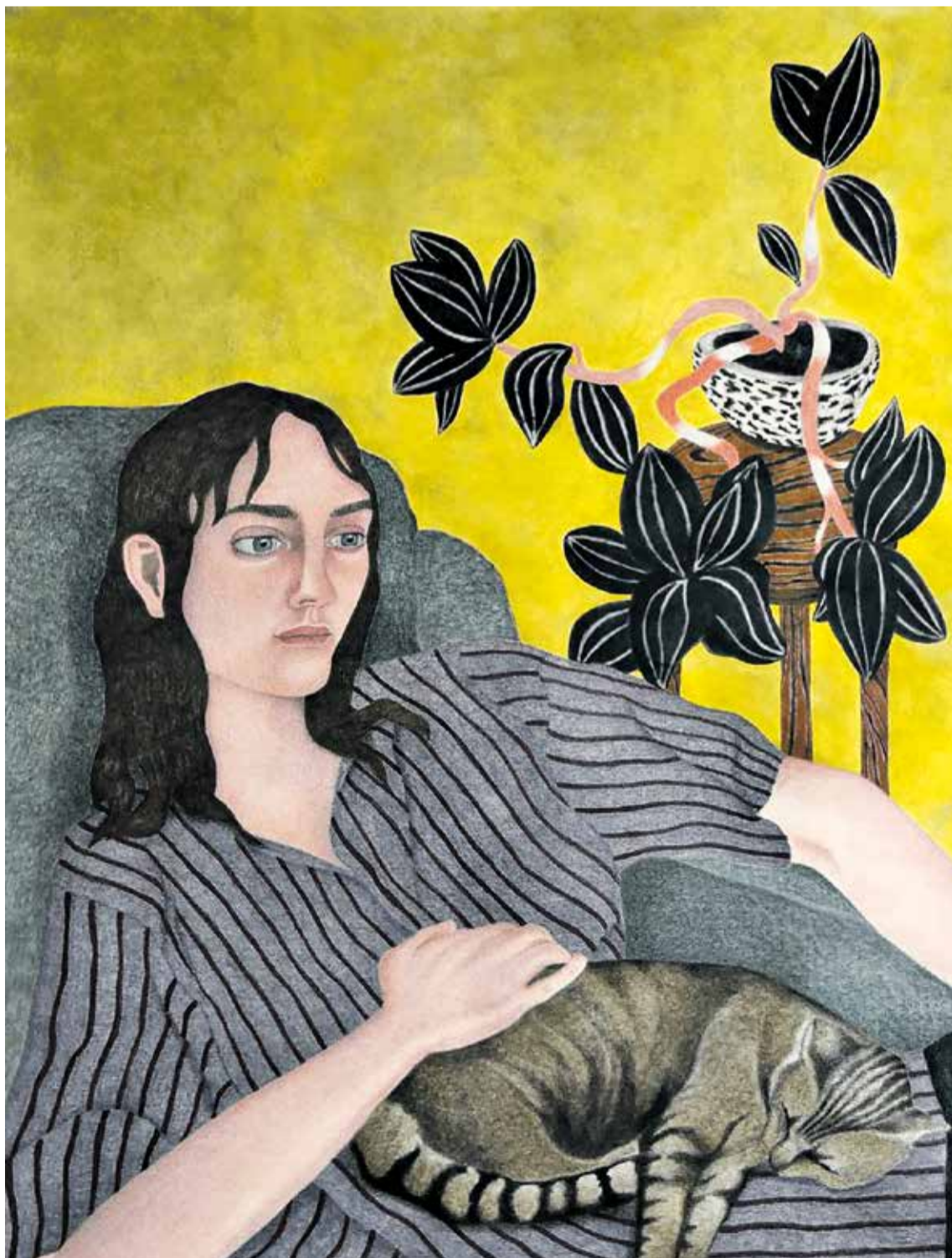
Maeve van Klaveren, Nowhere We Need to Be , 2024, Aquarellfarben, Pastellfarben, Pastellstifte und Zeichenkohle auf Papier, 105 × 79,8 cm

2014 folgte die Kampagne „Reconnaissons le féminicide“ des Vereins Osez le féminisme (Feminismus wagen, OLF) für die Aufnahme des Begriffs ins Strafbuch. Die Initiative traf zwar nur auf ein geringes Echo, doch das Thema war nun gesetzt. Ein Jahr später wurde das Wort „Fémicide“ in das große französische Wörterbuch „Robert“ aufgenommen. Danach tauch-