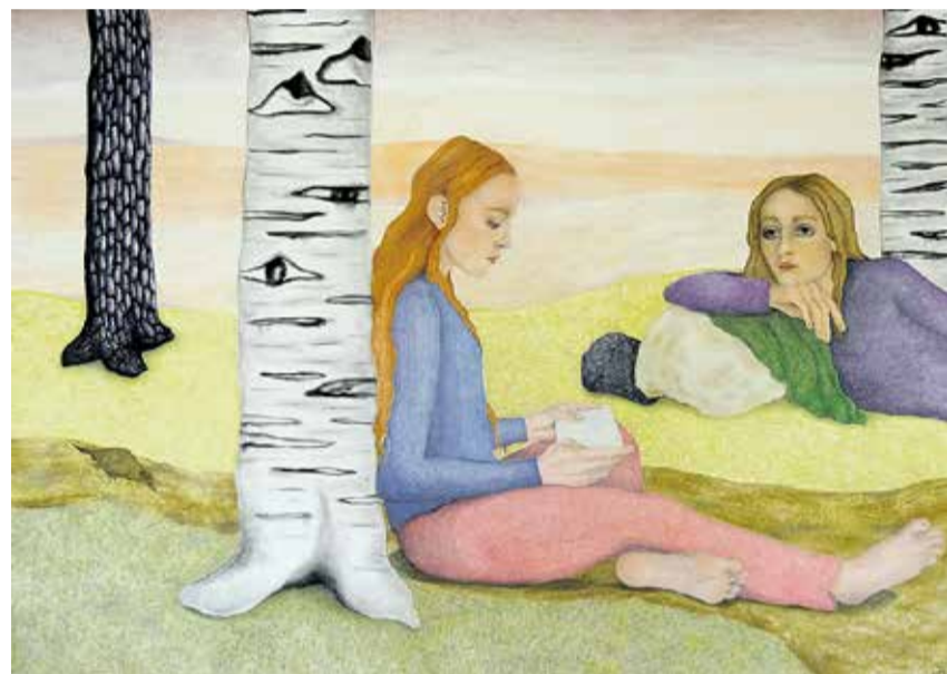
In the Fading Light, 2024, Aquarellfarben, Pastellfarben, Pastellstifte und Zeichenkohle auf Papier, 125 x 175 cm (zur Künstlerin siehe Seite 2)