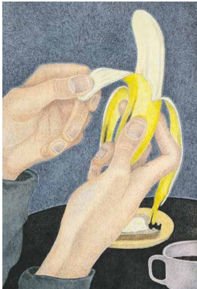
Maeve van Klaveren, Banana Peel , 2023, Aquarellfarben, Pastellfarben, Pastellstifte und Zeichenkohle auf Papier, 19,5 x 28,5 cm

Die Untersuchung des Senats droht den Fortbestand des Geschäftsmodells der Beratungsgiganten, das