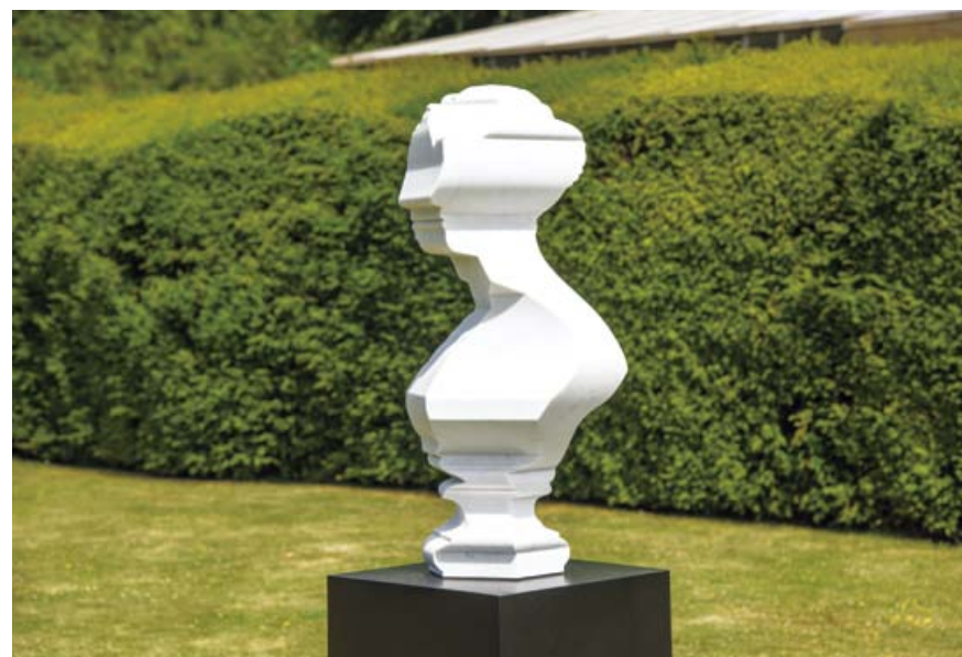
SCULPTURE 1504-2017, GLYNDEBOURNE, INSTALLATION VIEW, 2017, VARIOUS, BRONZE, MARBLE, STEEL, CORTEN

높은 아치, 매끄러운 실루엣 라인을 신선하게 살려내며, 모더니스트 조각가로서 면모를 인정받고 있다. 런던의 테이트 브리튼Tate Britain, 아테네의 더 허브The Hub 같은 권위 있는 기관에서 국제적 전시를 선보였고, 클리퍼드 찬스 조각상 Clifford Chance Sculpture Prize, 디어드리 허버드 조각상Deirdre Hubbard Sculpture Award 등에서 수상하며 거침없이 질주하고 있다. 한 미술 전문지의 기사에서는 그를 “제2의 앤