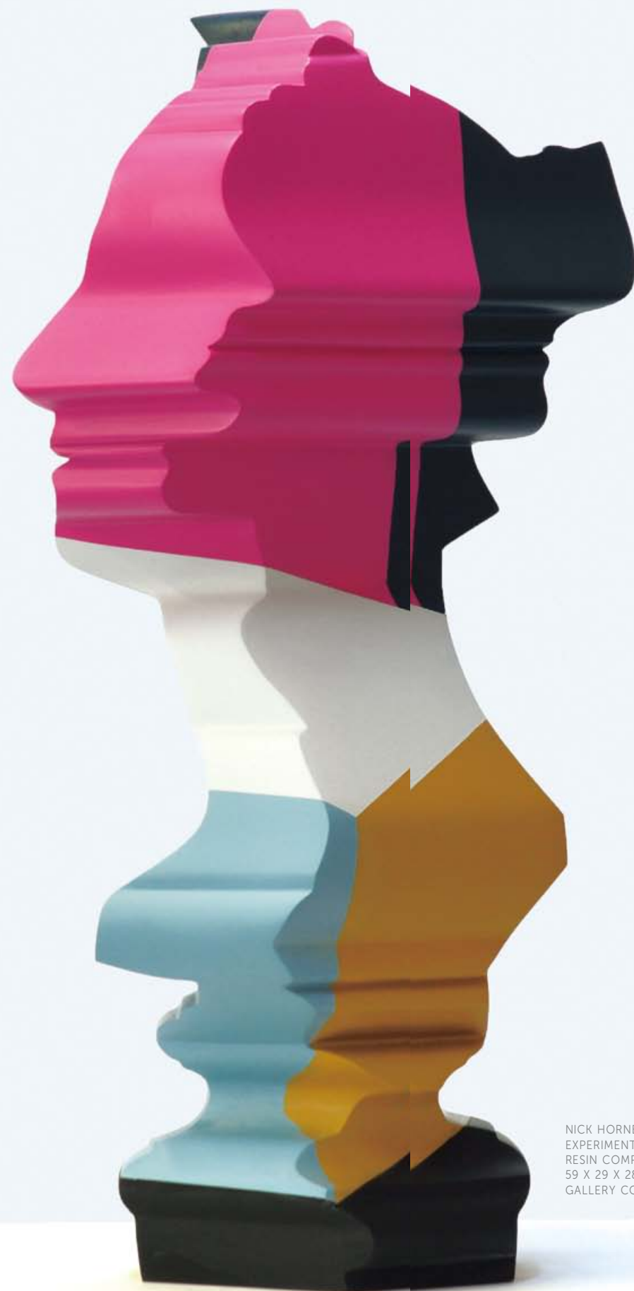
NICK HORNBY & SINTA TANTRA. MUSE: EXPERIMENTS IN COLOUR, 2015, MARBLE RESIN COMPOSITE, PAINT 59 X 29 X 28 CM UNIQUE © CHOI&LAGER GALLERY COLOGNE / SEOUL