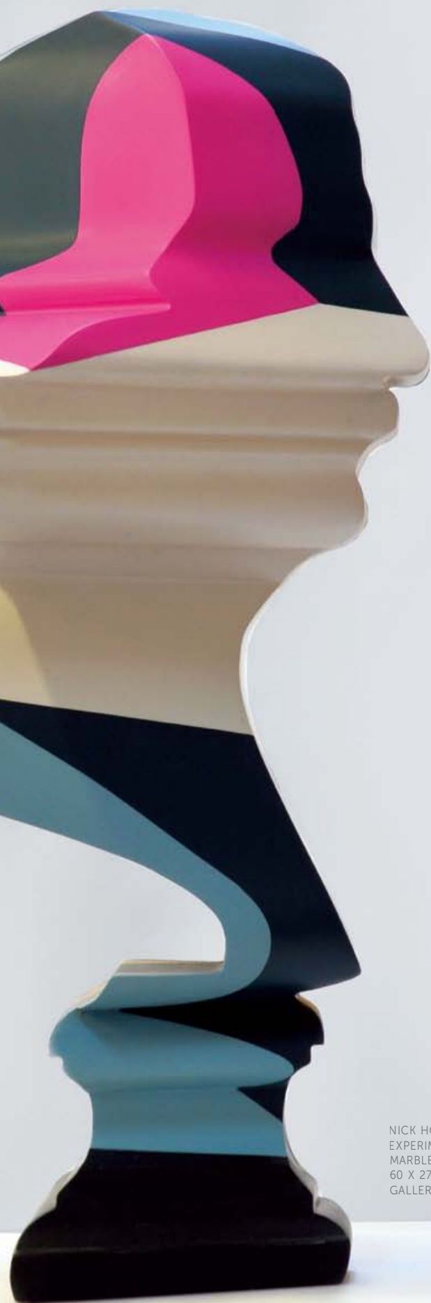
NICK HORNBY & SINTA TANTRA. PATRON: EXPERIMENTS IN COLOUR #2, 2015, MARBLE RESIN COMPOSITE, PAINT 60 X 27 X 35 CM UNIQUE © CHOI&LAGER GALLERY COLOGNE / SEOUL