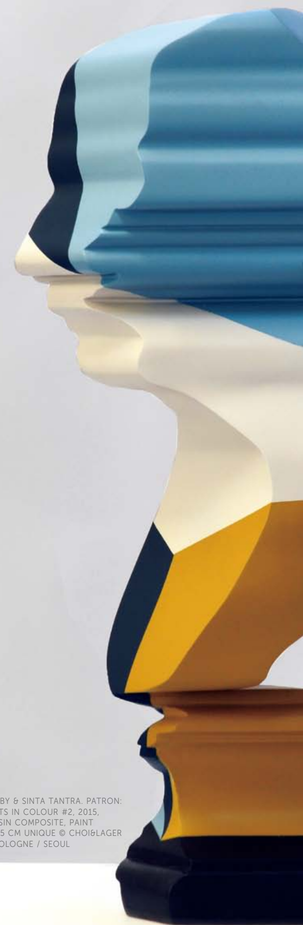
NICK HORNBY & SINTA TANTRA. PATRON: EXPERIMENTS IN COLOUR #2, 2015, MARBLE RESIN COMPOSITE, PAINT 60 X 27 X 35 CM UNIQUE