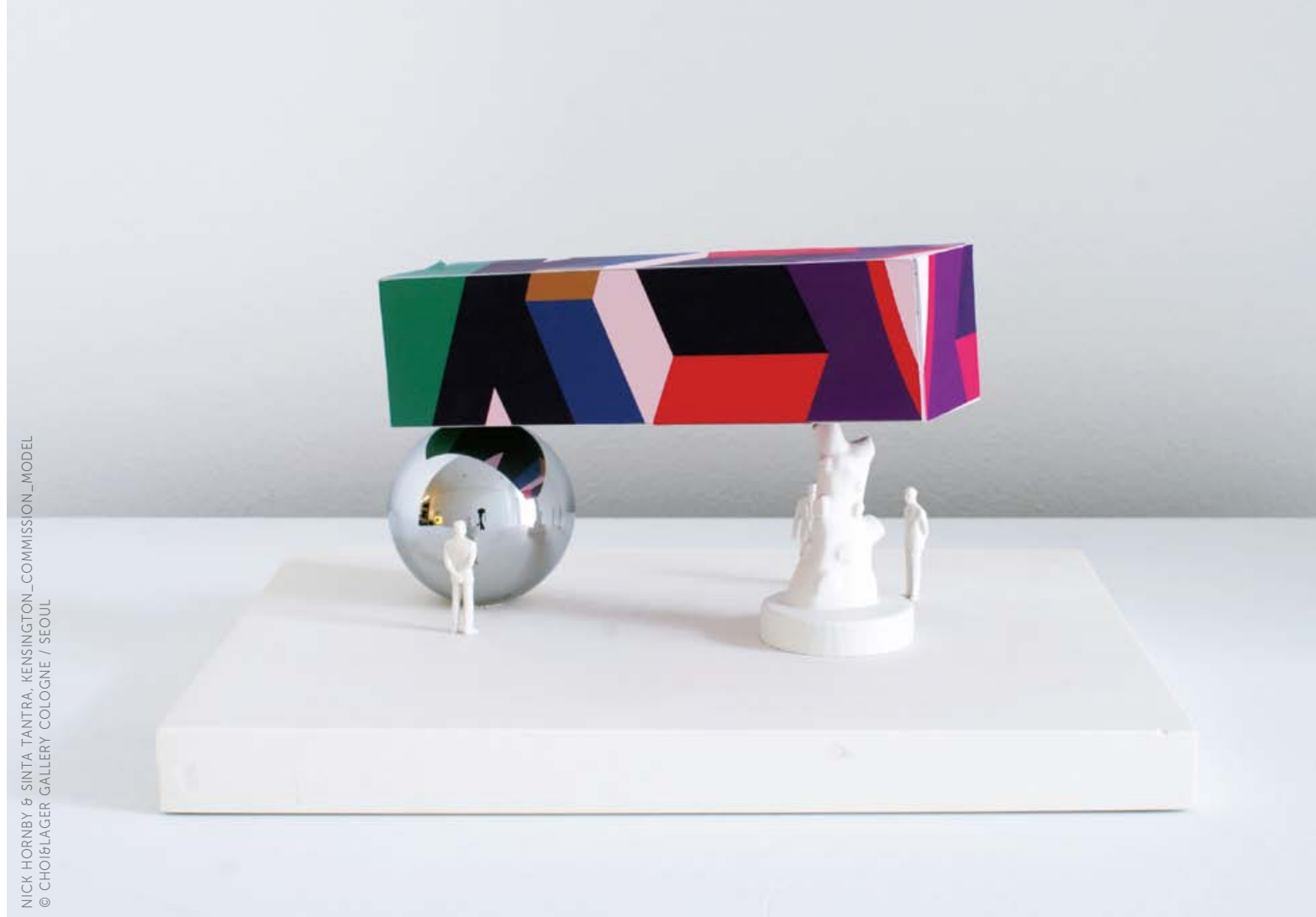
NICK HORNBY & SINTA TANTRA, KENSINGTON_COMMISSION_MODEL © CHOIBLAGER GALLERY COLOGNE / SEOUL

COOPERATION_NICK HORNBY & SINTA TANTRA WWW.HORNBYTANTRA.COM