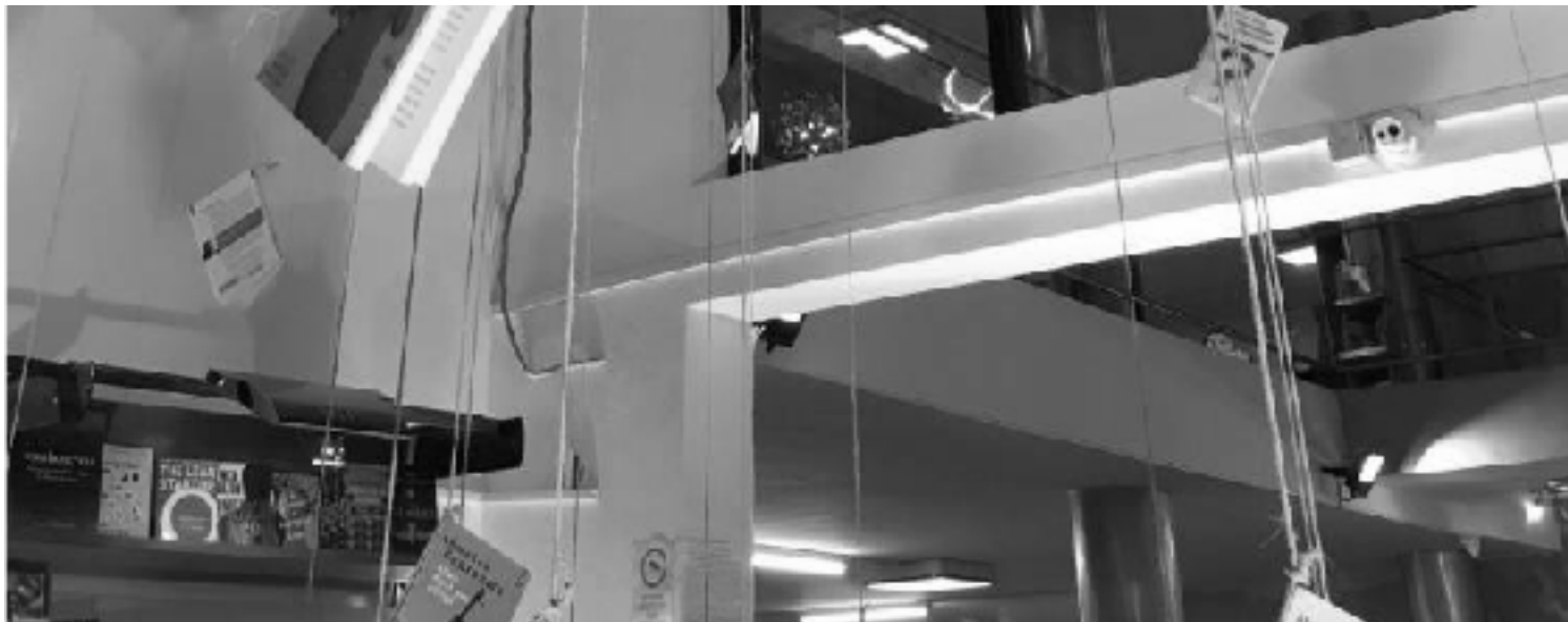
Installation de la librairie des quatre vents dans le Off de la 13e Biennale de Dakar.