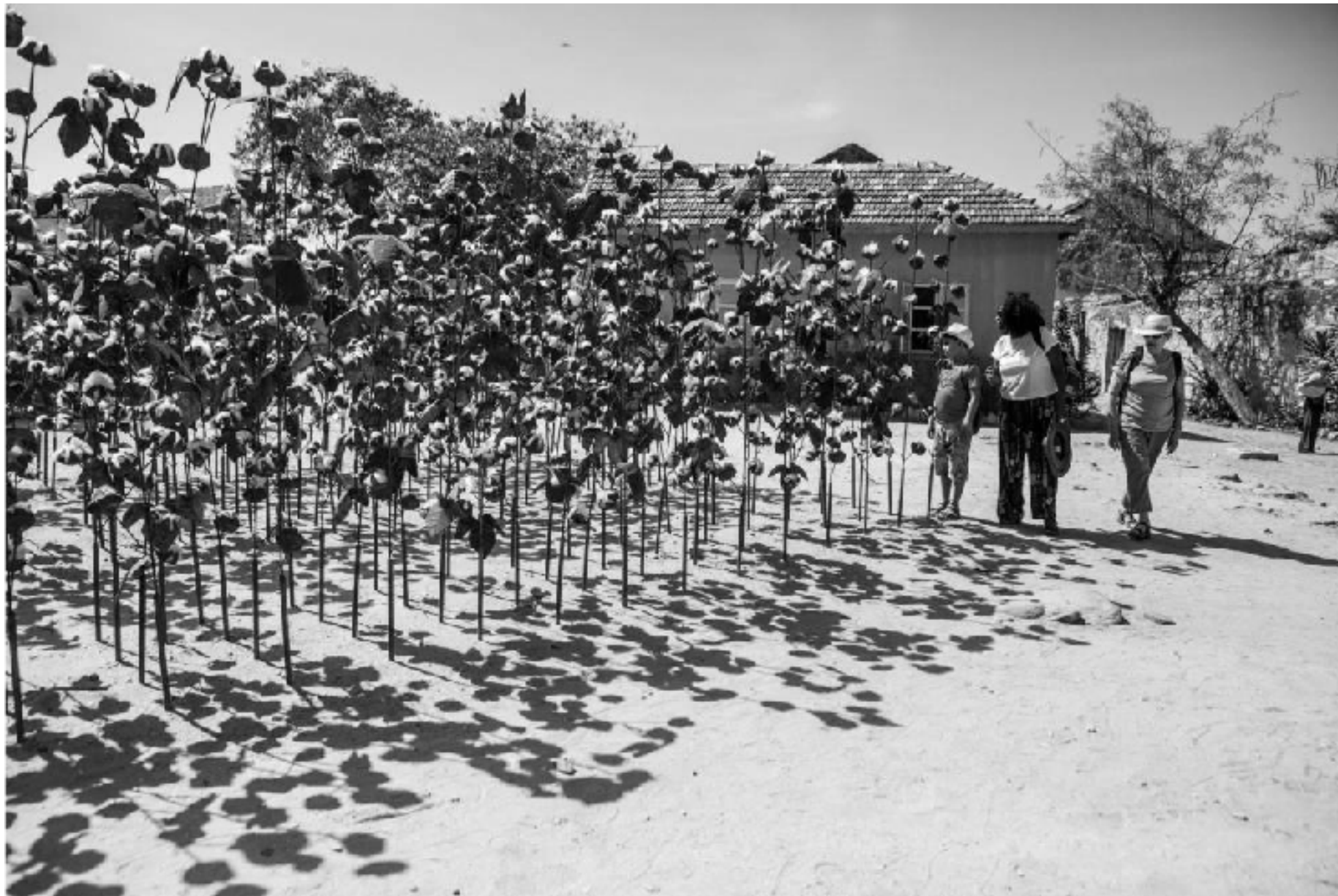
Installation "Champ de coton" de Soly Cissé sur l'île de Gorée lors de la 13e Biennale d'art contemporain de Dakar le 4 mai 2018.