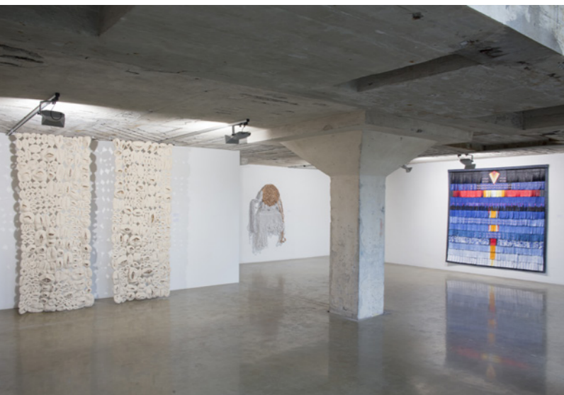
1 ABDOULAYE KONATÉ , Composition bleue orange Aly 1 , 2017, (høyre) og Amina Agueznay Aouinates, Little Eyes in Moroccan arabic , 2016, (venstre).