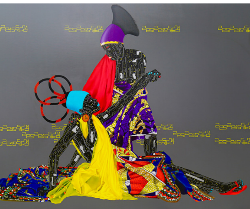
3 AMADOU SANOGO SANS . Akryl på lerret.