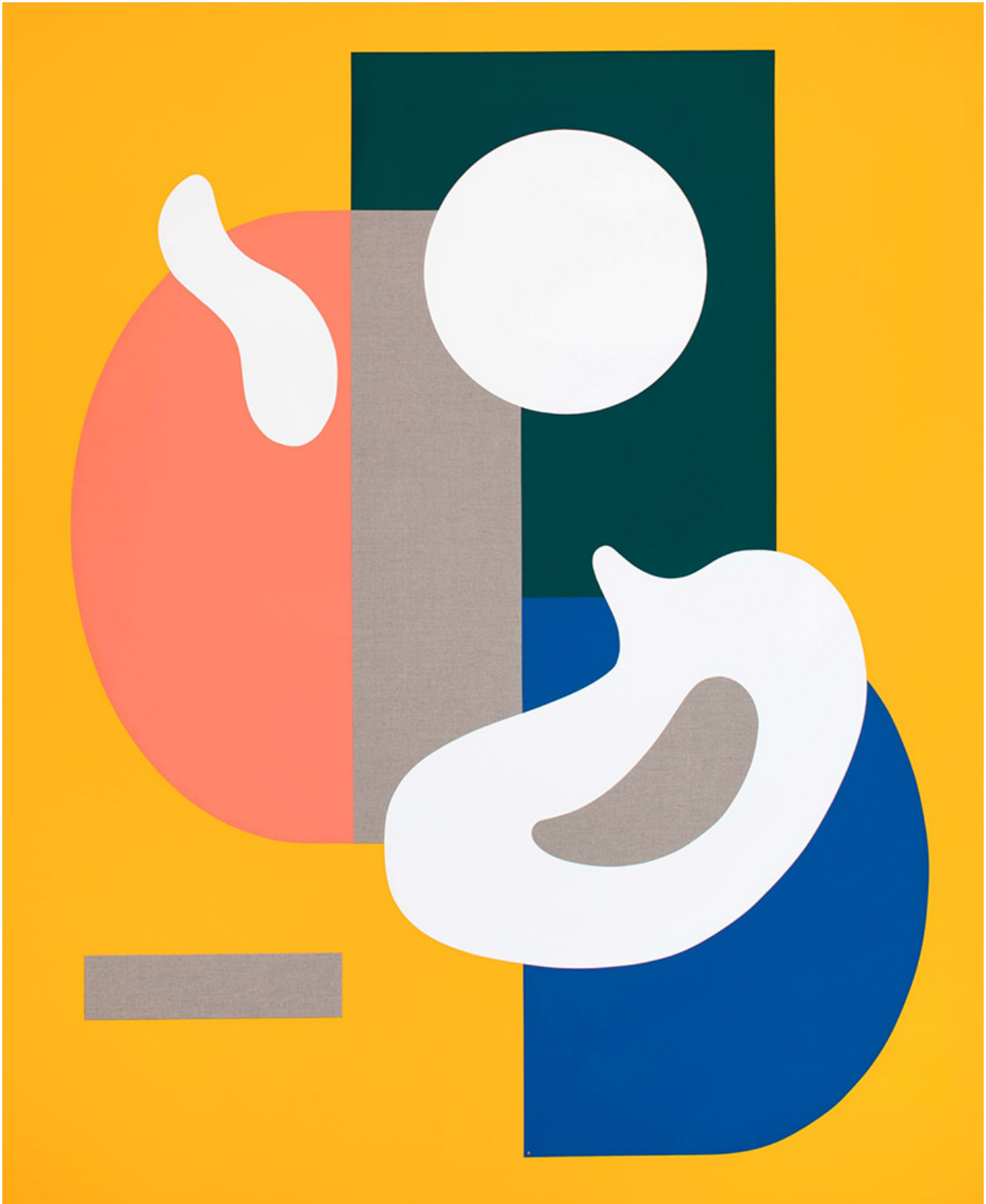
CITRINE AND EMERALD, 2021 Pintura al temple sobre lino 160 x 130 cm

1598, el astrónomo holandés Petrus Planchius convirtió al pájaro en una nueva constelación). El espacio se ve aún más elevado por los sonidos atmosféricos de dos aves del paraíso haciendo el amor, que se reproducen a través de dos altavoces antiguos, creando una sensación de circularidad a medida que la exposición llega a su fin. Al mismo tiempo, es significativo que el canto de los pájaros tome el relevo de la narración humana, tal vez señalando una sensación de libertad justo cuando las pinturas abrazan una sensualidad recién descubierta.