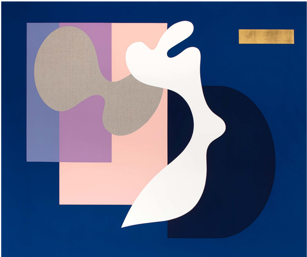
BEAUTIFUL AS THE NIGHT, 2021 Pintura al temple con pan de oro de 24 quilates sobre lino, 100 x 120 cm

Sinta Tantra entrelaza en su exposición Birds of Paradise , pintura, escultura, diapositivas, sonido y material de archivo para guiar al espectador en un viaje a través de tres espacios distintivos que trazan la transformación del ave a través de la historia en el contexto del discurso contemporáneo en torno a la alteridad y poscolonialismo.